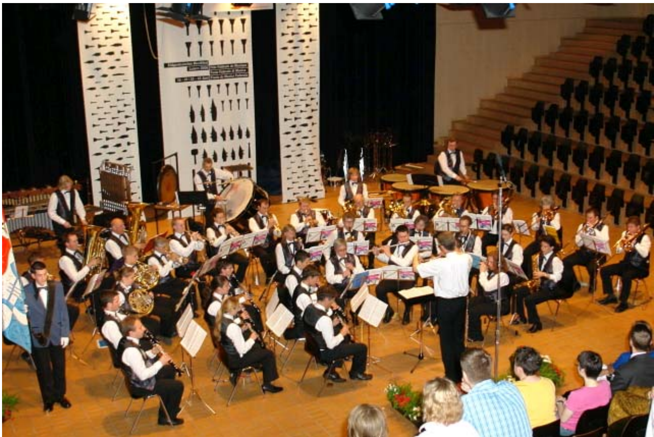
Aufführung Pflichtstück am Eidgenössisches Musikfest Luzern 2006