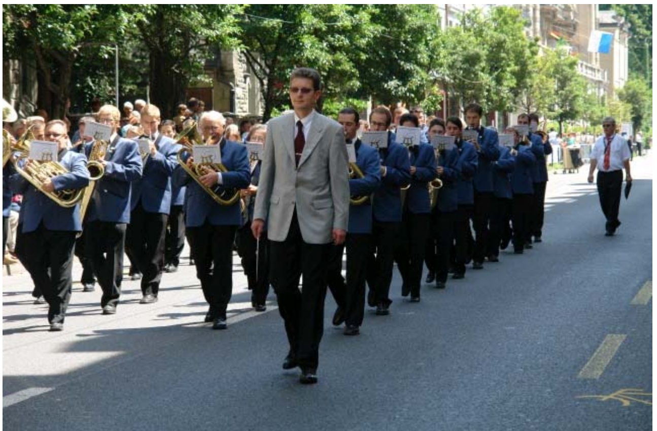
Marschmusikparade am Eidgenössisches Musikfest Luzern 2006

Sämtliche Werbemassnahmen werden auf den folgenden Seiten noch näher beschrieben.